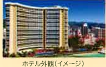
ホテル外観(イメージ)

ワイキキビーチが目の前のハワイ屈指の人気ホテルです。ホテル内のインフィニティプールはプールと海とが繋がっているように！